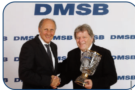
Norbert Haug (r.) wurde mit dem DMSB-Pokal geehrt.