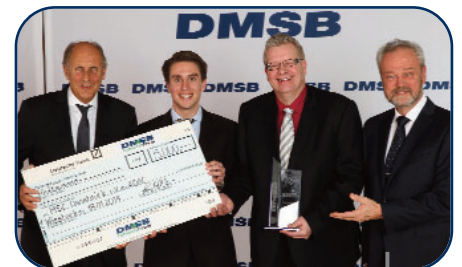
Der DMSB-Umweltpreis 2013 geht an den MSC Osnabrück.

Elektro- und Hybridantrieb in eigenen Klassen gewertet. Über zwei Dutzend Teilnehmer gingen an den Start und bewiesen eine erstaunliche Vielfalt an Fahrzeugkonzepten. Die Jury hob in ihrem Urteil gleich mehrere Punkte hervor, die die Veranstaltung zu einem Modell auch für andere Events macht. Neben dem Beweis der Tauglichkeit von alternativen Antriebskonzepten für den sportlichen Wettbewerb erzielte die Veranstaltung auch eine große öffentliche Aufmerksamkeit. Die Organisatoren stellten das ganze Event zudem nachhaltig auf die neuen Antriebsformen ein. So wurden Fahrer und Sportwarte auf die spezifischen Herausforderungen der neuen Technologien geschult und eigene Vorkehrungen und Sicherheitsmaterialien für Hochvoltantriebe bereitgestellt.