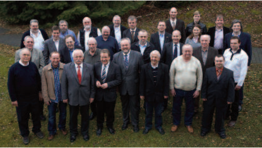
Hochkarätige Teilnehmer: Bei der Umweltfachtagung des DMSB sind Motorsportexperten, Ministerien und Spitzenverbände im Dialog.

DMSB-Präsident Torsten Johné fordert Nachhaltigkeit – Motorsport bereits in vielen Belangen Vorreiter im Umweltschutz