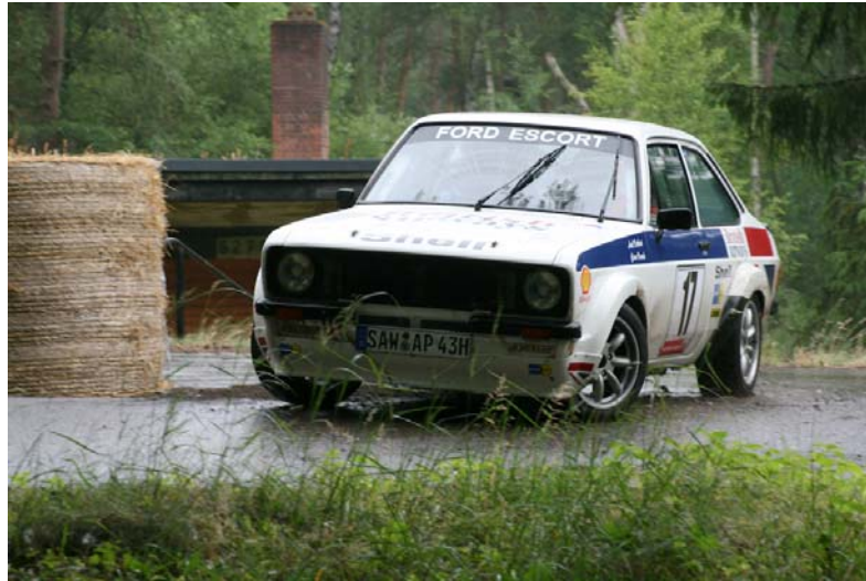
Axel Potthast / Elmar Pernsch behalten die Führung im HOP

Die ersten Zehn nach vier Veranstaltungen: