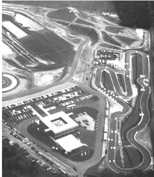
Luftbild RSG Kartbahn Embsen Clubsalom Fahrtrichtung Uhrzeigersinn